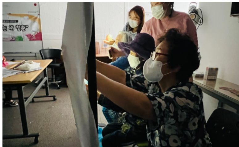
그림자 연극 관람 & 체험